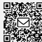
お問い合わせフォーム