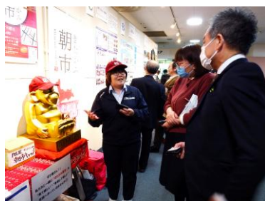
昨年のポスターセッションの様子