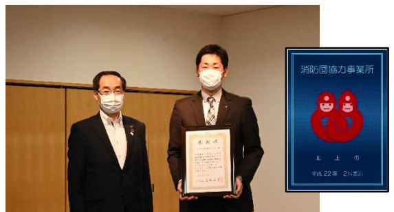
令和3年5月、感謝状授与式の様子

普段の工作中に緊急の消防団活動が必要となった場合、消防団活動を優先することを社として認めています。周りの社員も協力し、消防活動に専念できるよう応援しています。