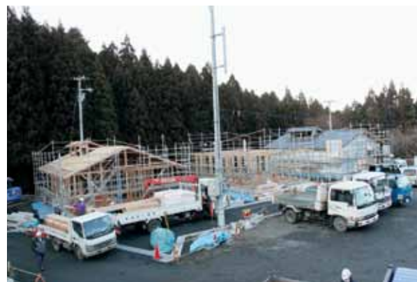
3月完成に向けて工事が進む箱崎白浜復興公営住宅(戸建)