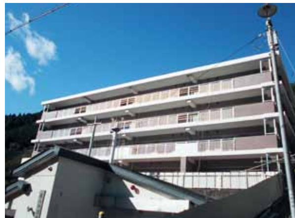
25年12月に完成・入居となった花露辺復興公営住宅(集合)