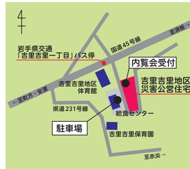
駐車場：大槌町給食センター